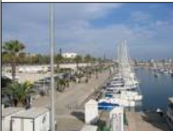
« olympic_port_barcelona »